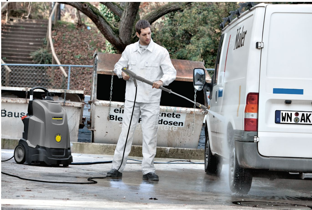
HDS 5/11 U