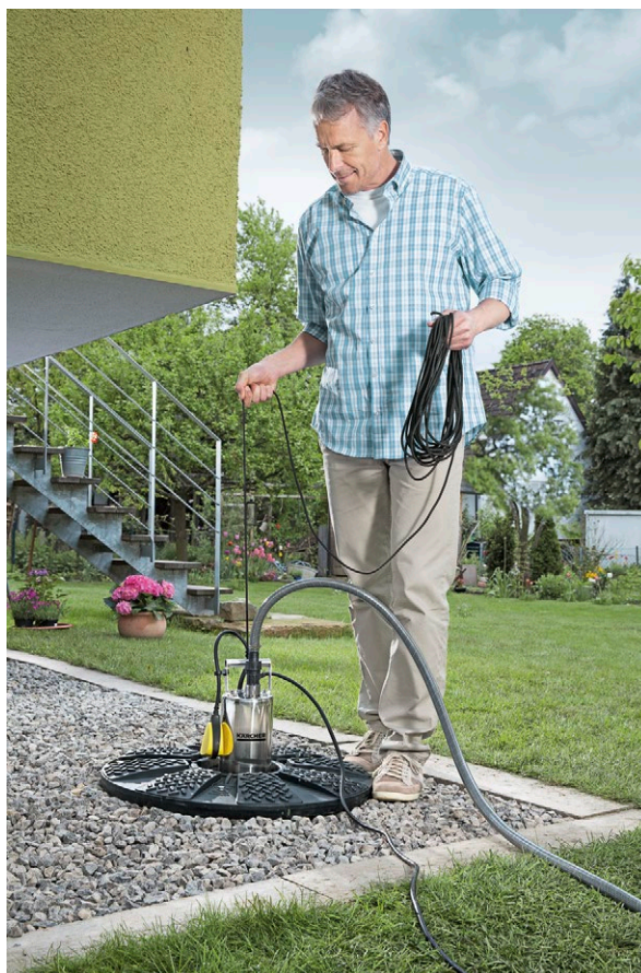
BP 2 Cistern

■ Корпус насоса, резьбовой штуцер и ручка из нержавеющей стали